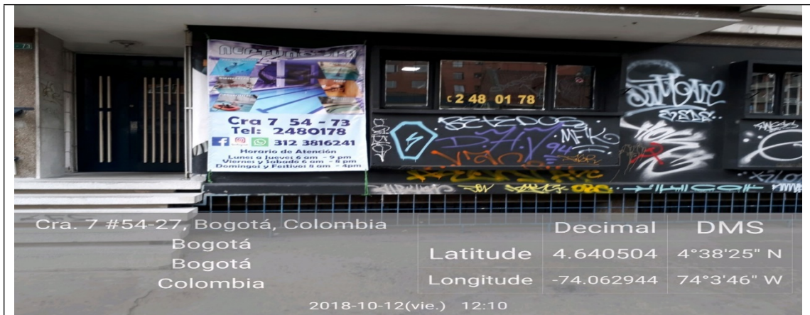
Registro fotográfico del 12-10-2018. Operativo de Control